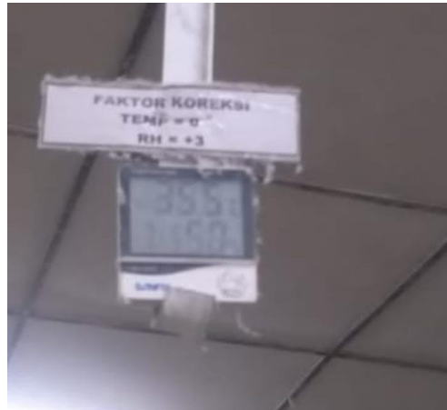
Lampiran 1 RH dan Suhu Ruangan