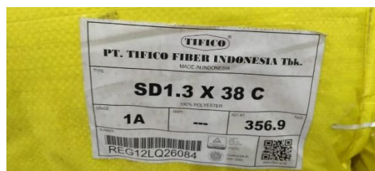
Lampiran 6 Type Material Polyester