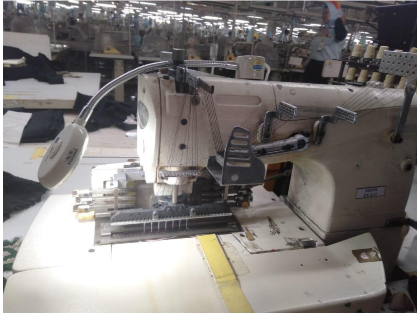
Lampiran 4 Mesin smock