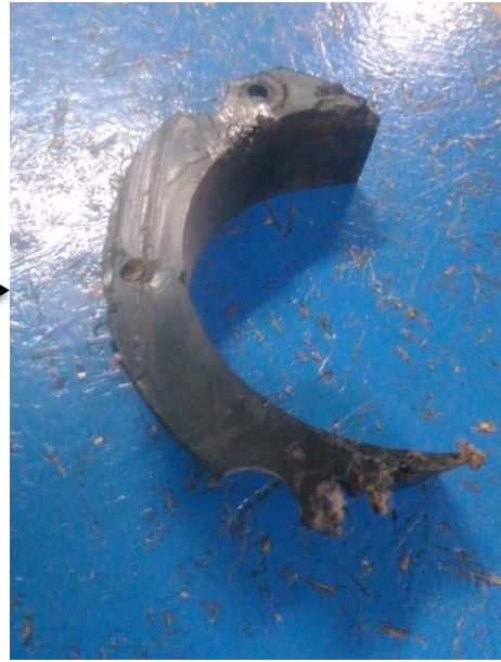
(Bantalan Beam yang terkena gesekan)