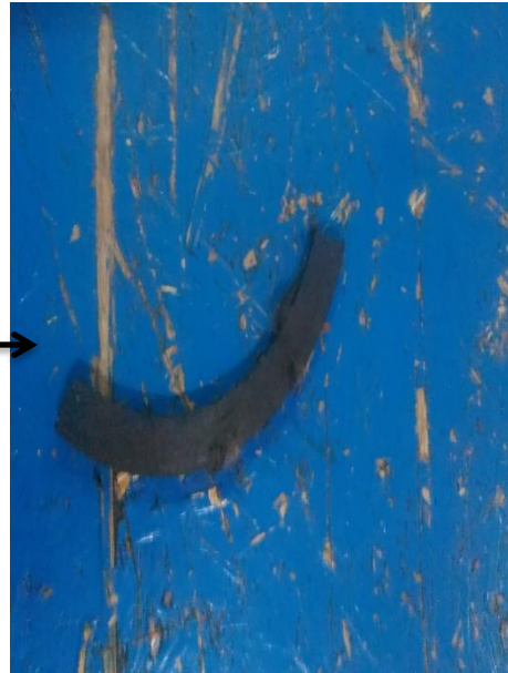
(Breaklinning yang pecah)