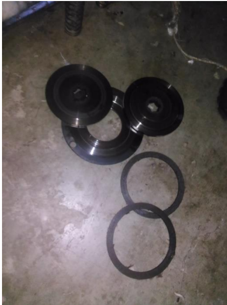
(Breaklinning yang utuh)