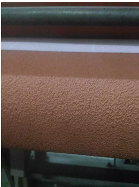
(Rubber Strip yang tajam)