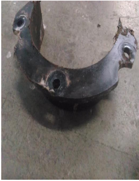
(Bantalan beam yang normal)