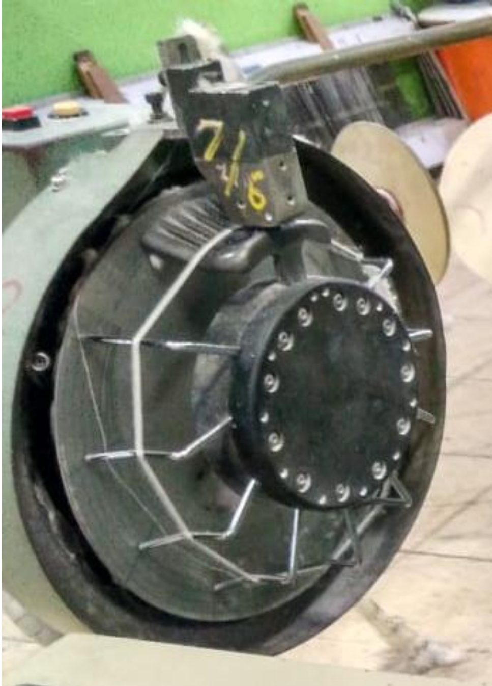
Lampiran 1 FDP Pin AJL Tsudakoma ZA 205i