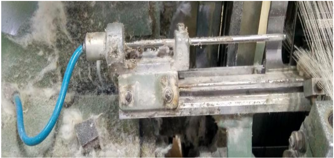
Lampiran 3 Main nozzle