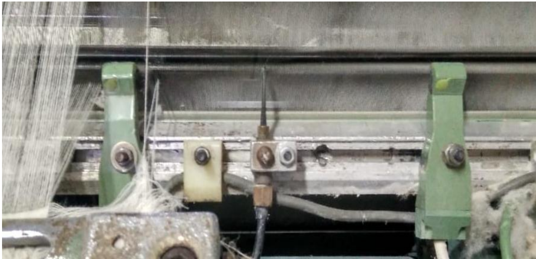
Lampiran 4 Feeler H1, Sub nozzle, dan Feeler H2