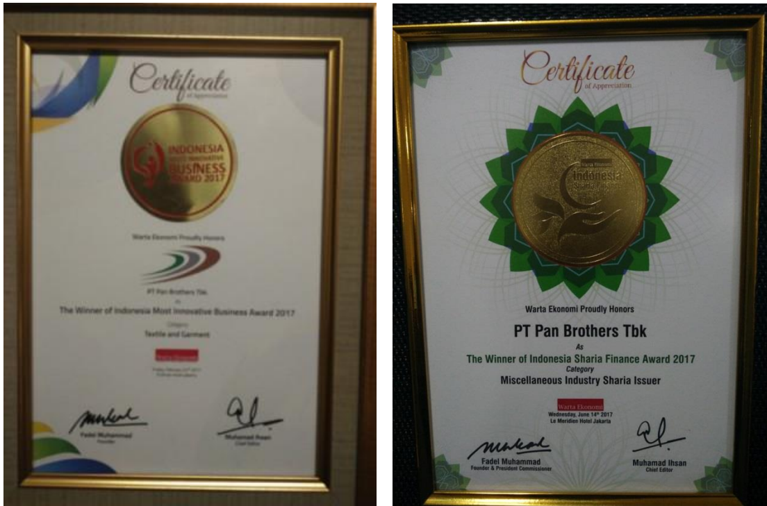
Lampiran 1 Awards yang diraih oleh PT Pan Brothers Tbk