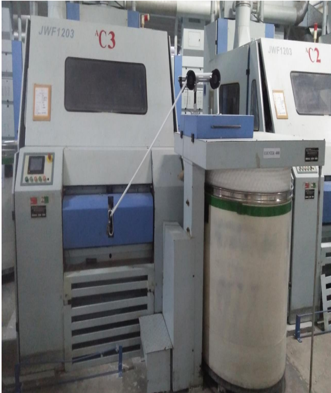
Lampiran 1 Mesin carding type JWF 1203