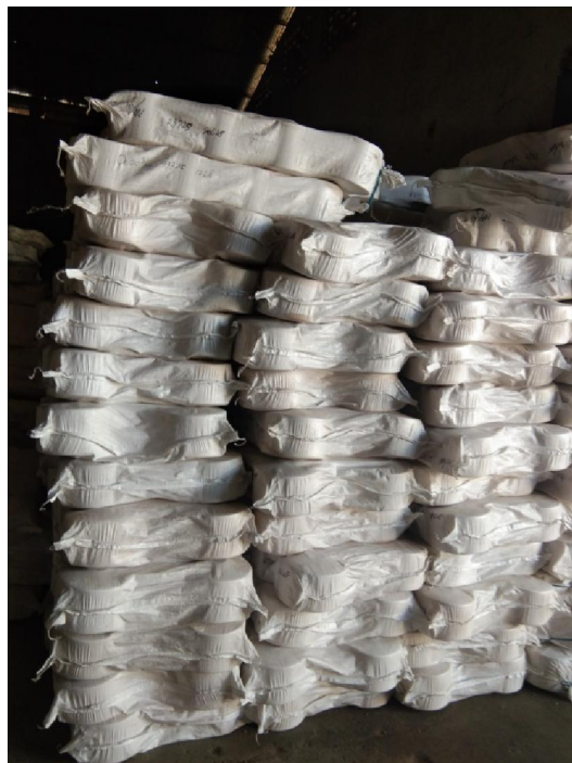
Lampiran 2 Tumpukan Benang