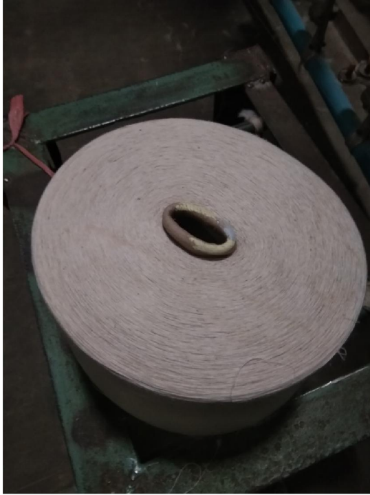
Lampiran 3 Gulungan Benang Berjamur