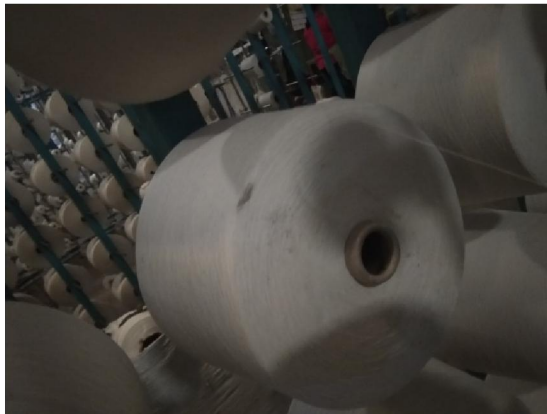
Lampiran 4 Gulungan Benang Kotor