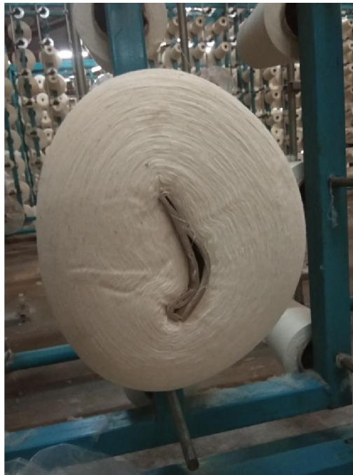
Lampiran 1 Gulungan Benang Cone Penyok