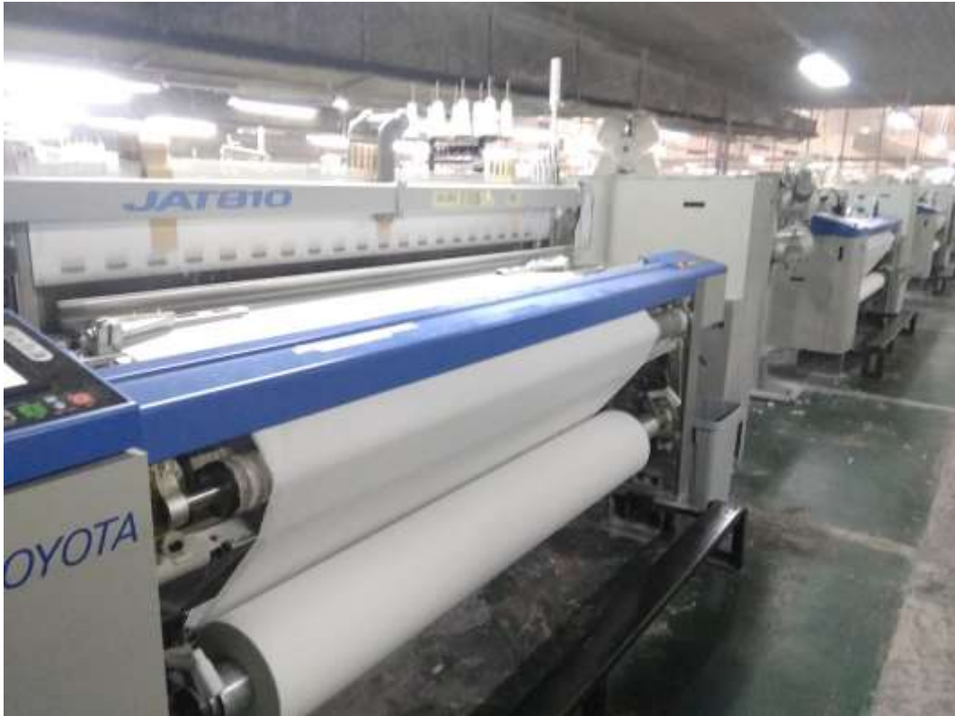
Gambar 5.4 Proses pertenunan