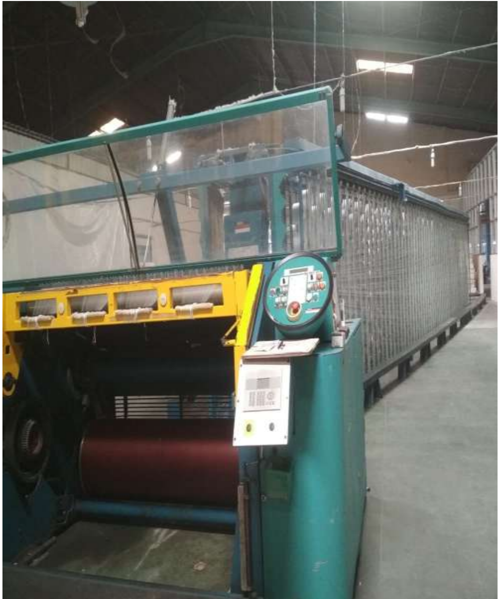
Gambar 5.2 Mesin warping