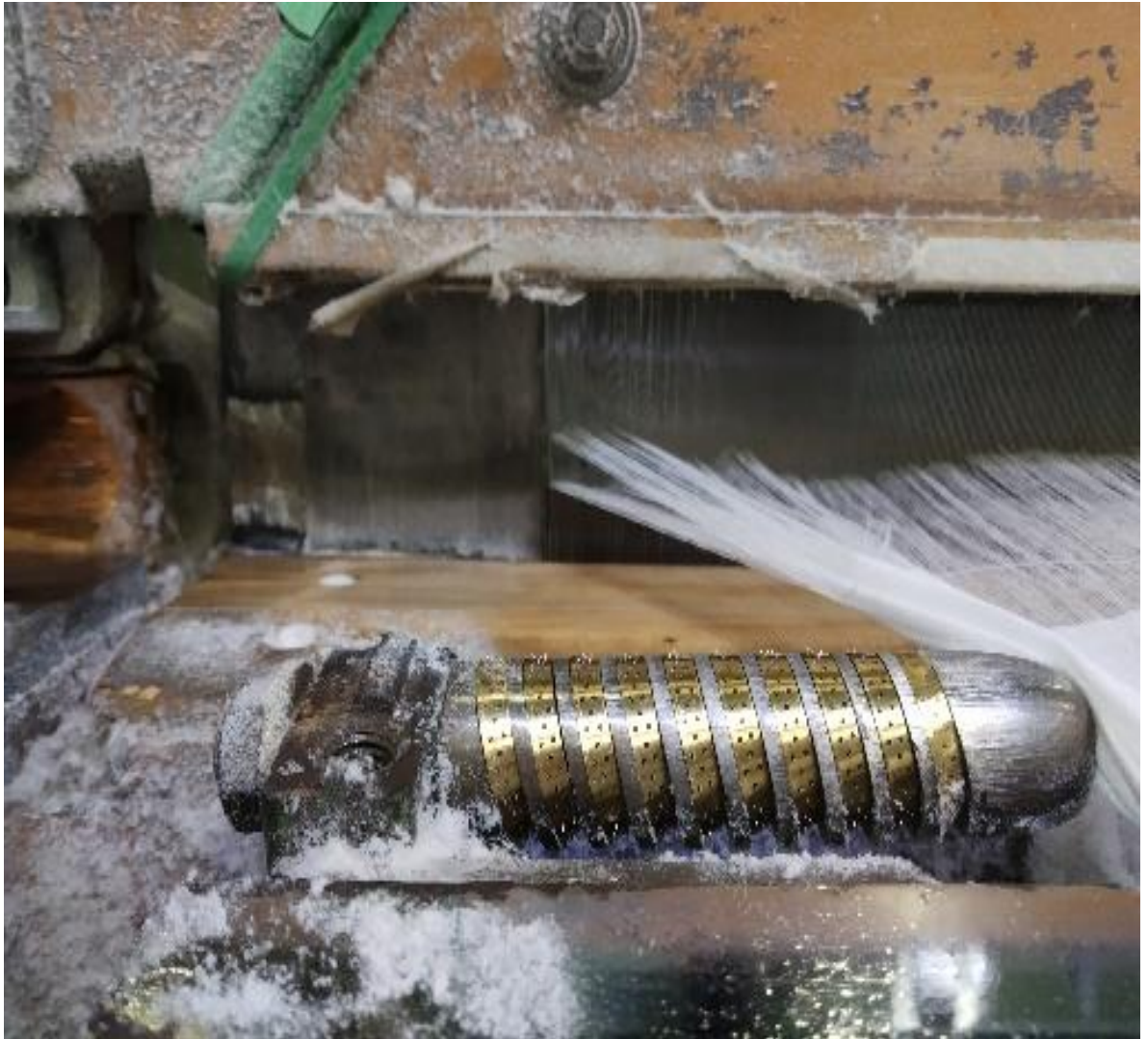
Lampiran 3 jenis- jenis Ring temple