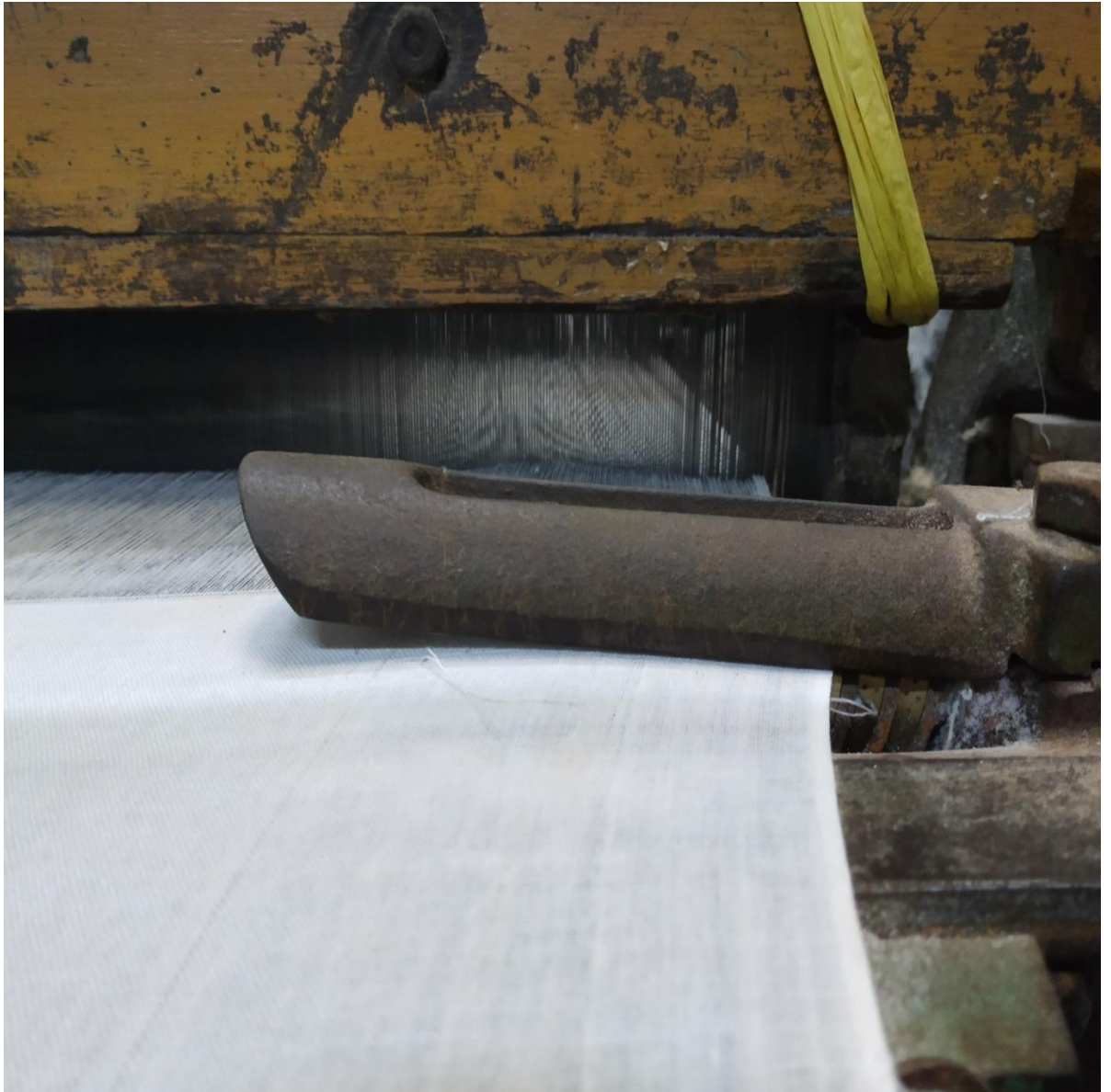
Lampiran 5 Gambar Pembongkaran Ring Temple