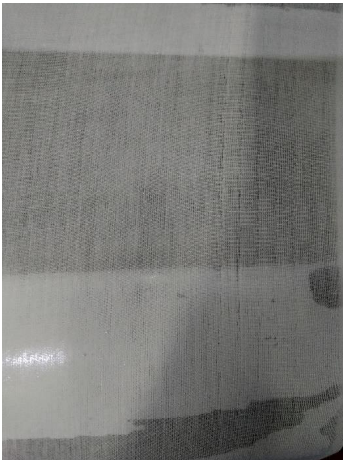
Lampiran 1 Cacat kain berlubang