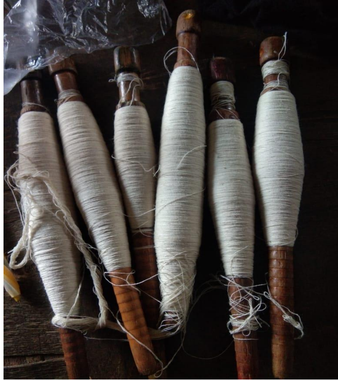
Lampiran 1 Contoh cacat gulungan palet