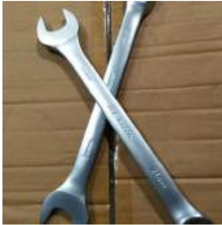
Lampiran 1 Kunci Pas