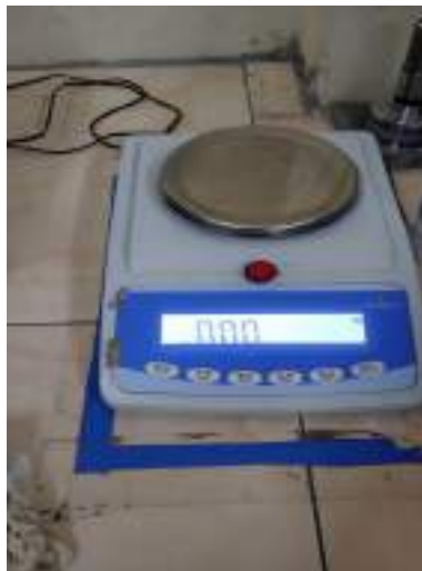
Lampiran 3 Timbangan