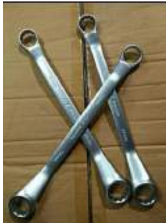
Lampiran 2 Kunci Ring