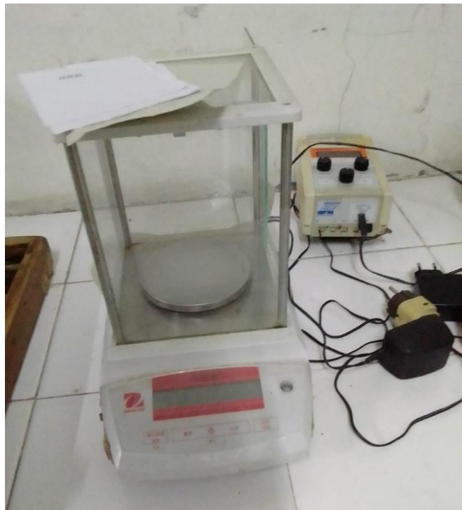
Lampiran 2 Timbangan Elektrik Ne