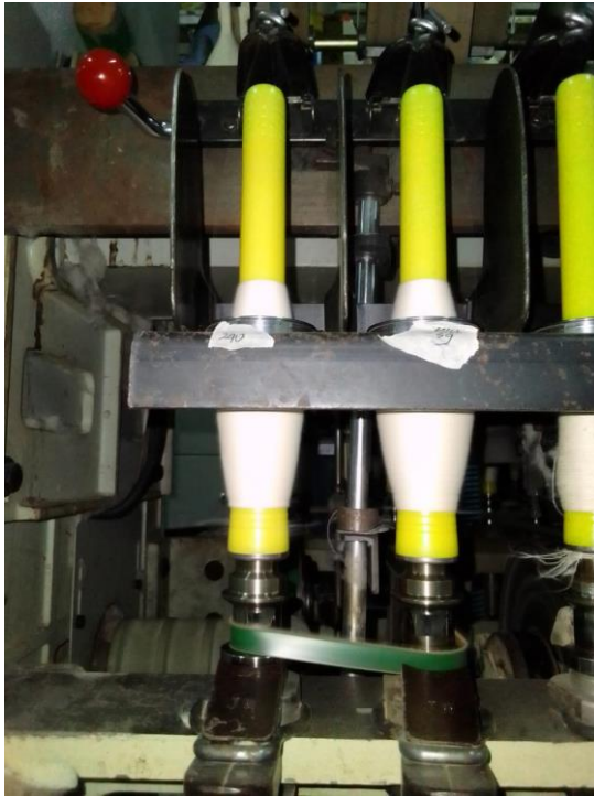
Lampiran 1 Spindle Tape Meleset Ke Bawah