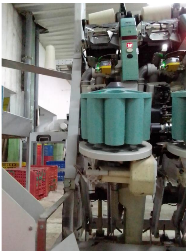
Lampiran 5 Benang Gembos Diproses Pada Mesin Winding