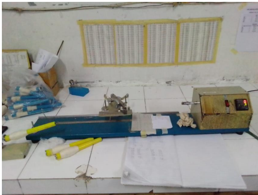
Lampiran 4 TPI Tester