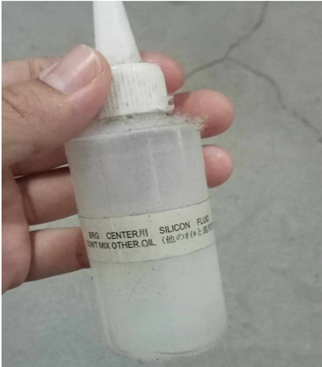
Lampiran 1 Contoh pelumas untuk cutter