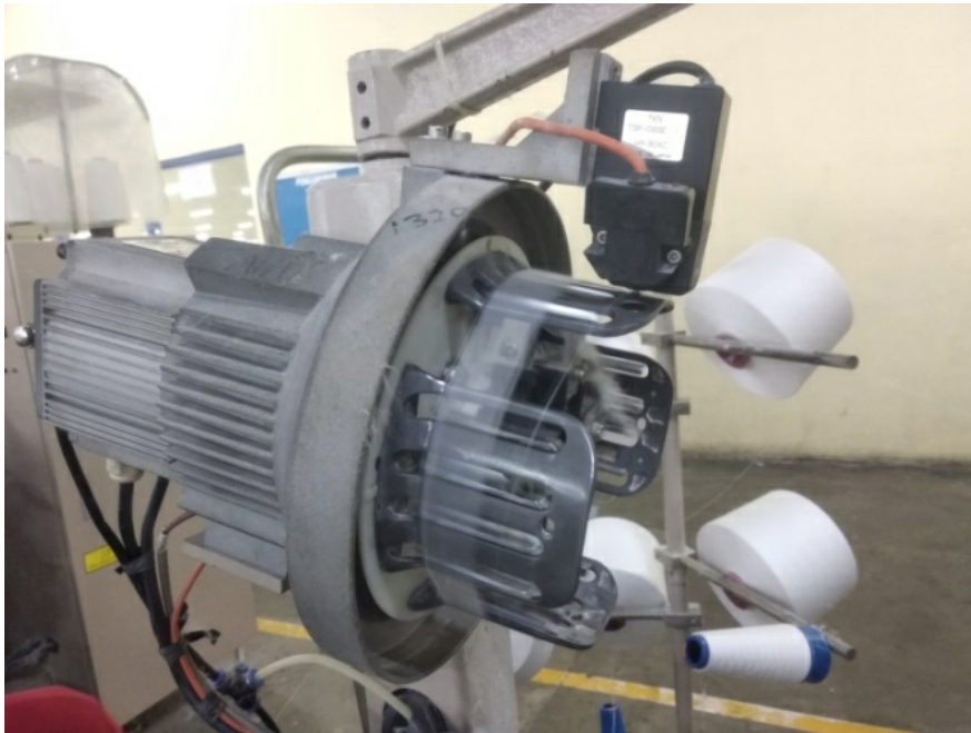
Lampiran 1 Accumulator dan hasil percobaan di mesi AJL 340