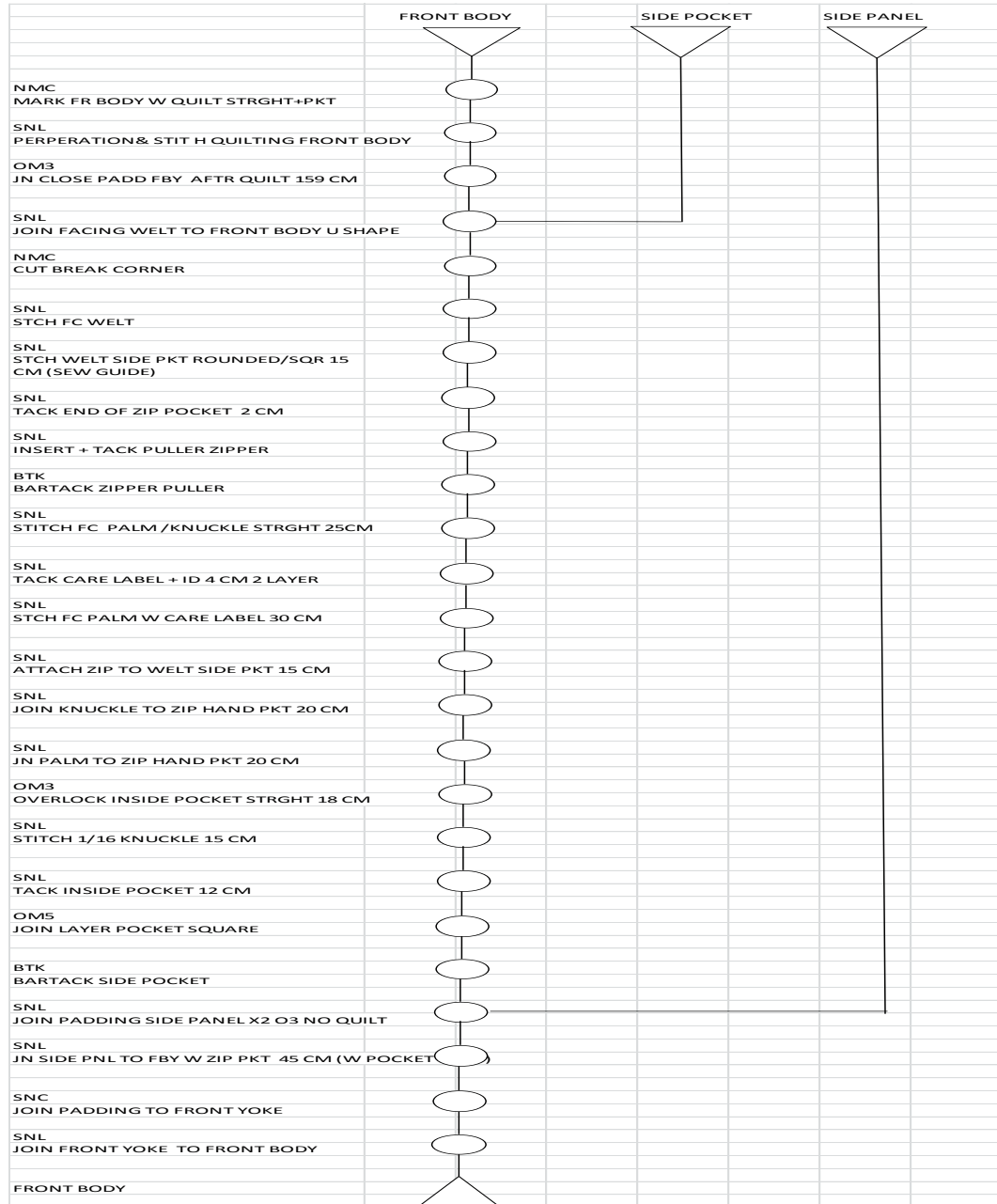
Lampiran 1 OPC Padded Jacket A4TJ5 Front Body