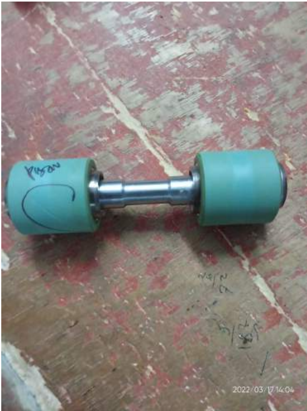
Lampiran 5 Top roll Cacat