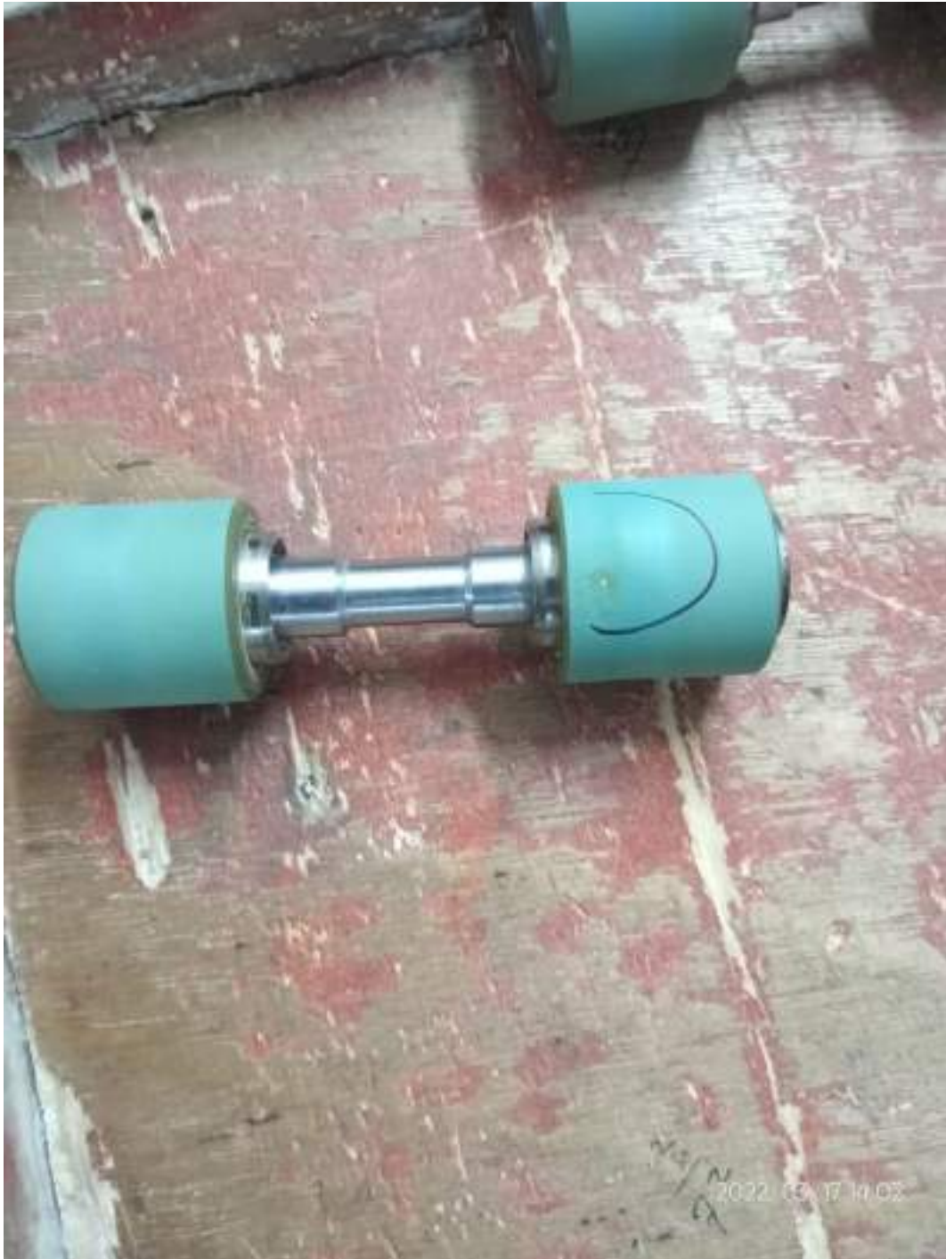
Lampiran 6 Top roll Cacat