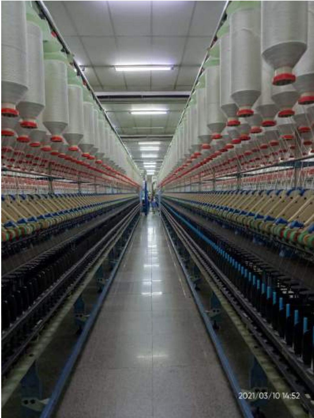
Lampiran 7 Mesin Ring Spinning