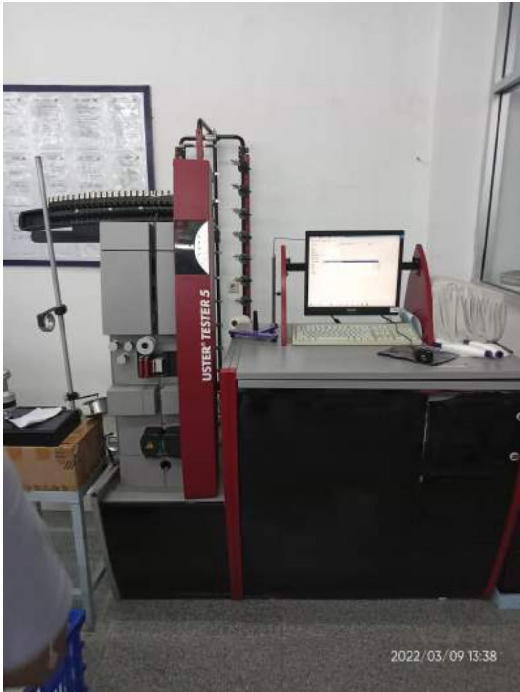
Lampiran 8 Mesin Uster Tester 5