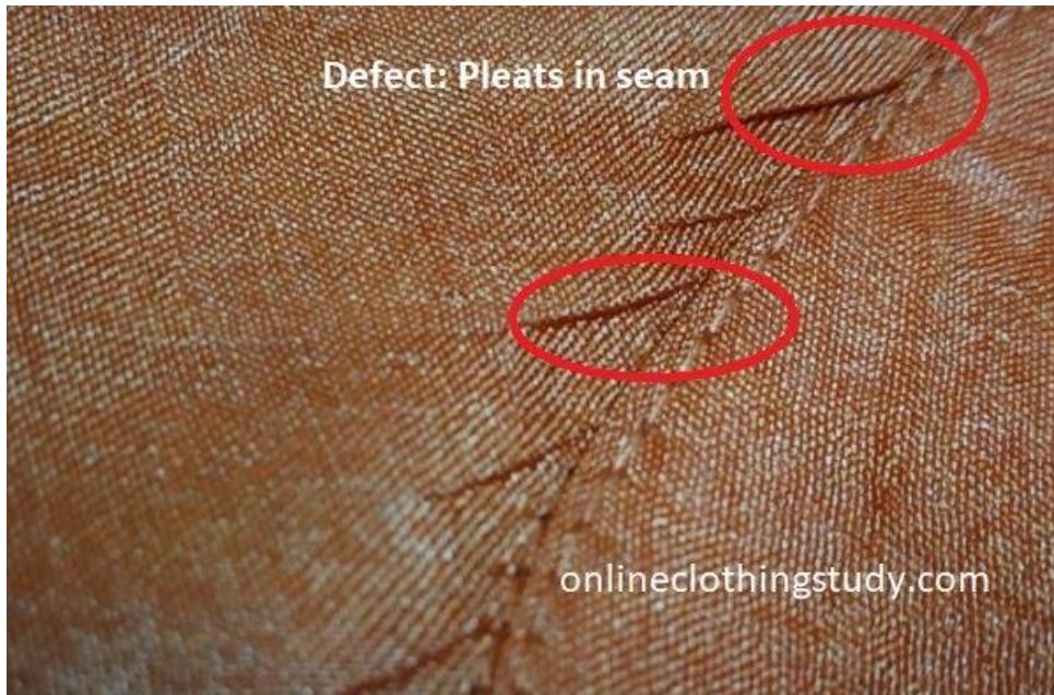
Gambar 2 Contoh gambar Defect Pleat