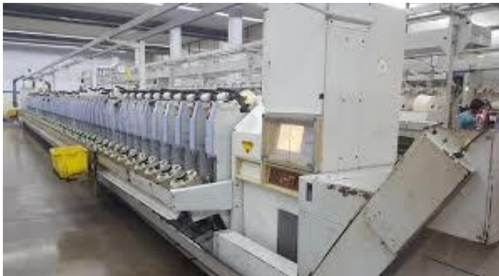
Lampiran 2 Mesin Winding Magazine Type