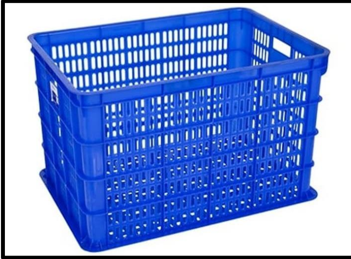
Lampiran 1 Gambar keranjang tempat Cop