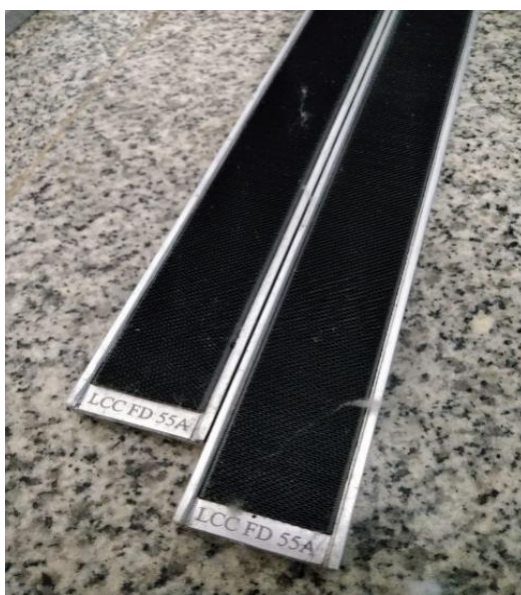
Lampiran 2 Wire Top Flat