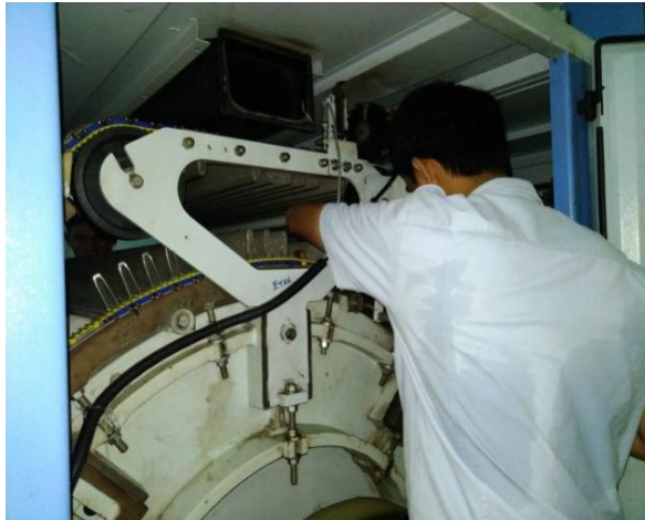
Lampiran 3 Setting Jarak Antara Top Flat Dengan Cylinder