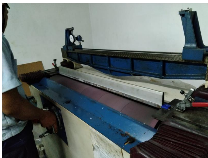
Lampiran 8 Grinding Wire Top Flat