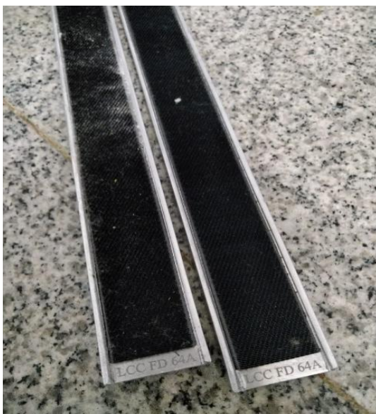
Lampiran 1 Wire Top Flat