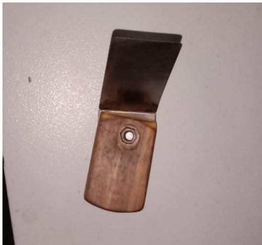
Lampiran 4 Alat Setting Jarak Antara Top Flat Dengan Cylinder