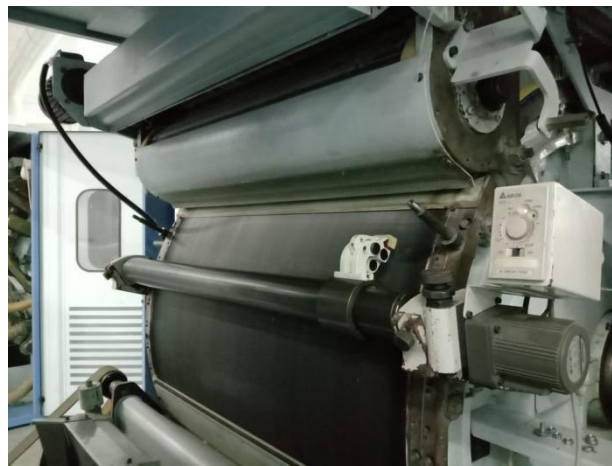
Lampiran 7 Grinding Wire Cylinder