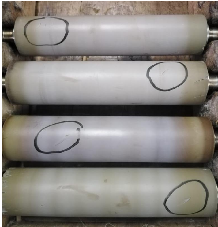
Lampiran 1 Top roll cacat