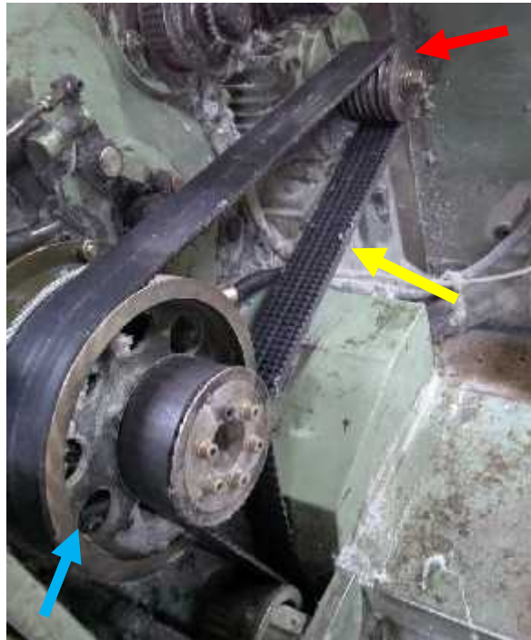
Gambar 16 contoh standar multi wedge belt