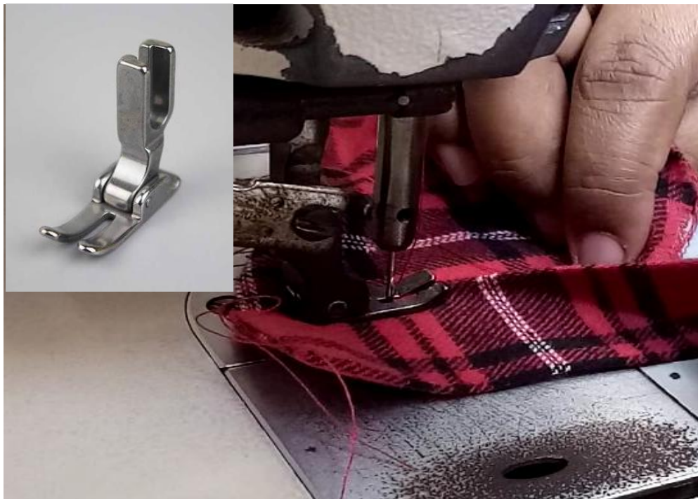
Gambar Sepatu CR 1/16