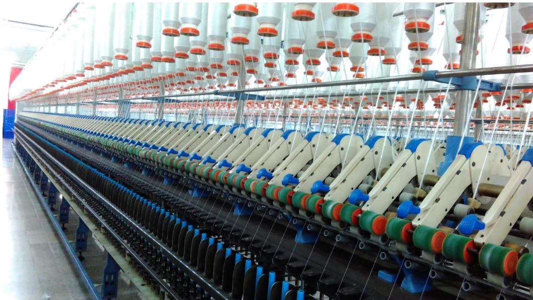
Lampiran 2 Mesin Ring Spinning