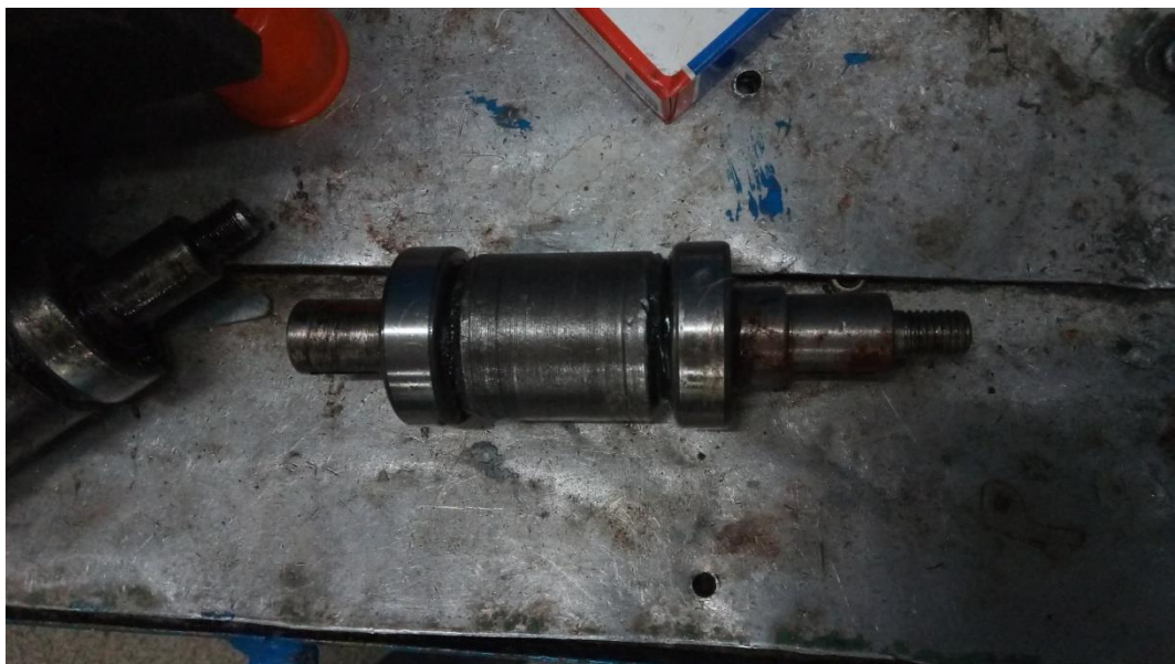
Lampiran 4 Bearing Shaft