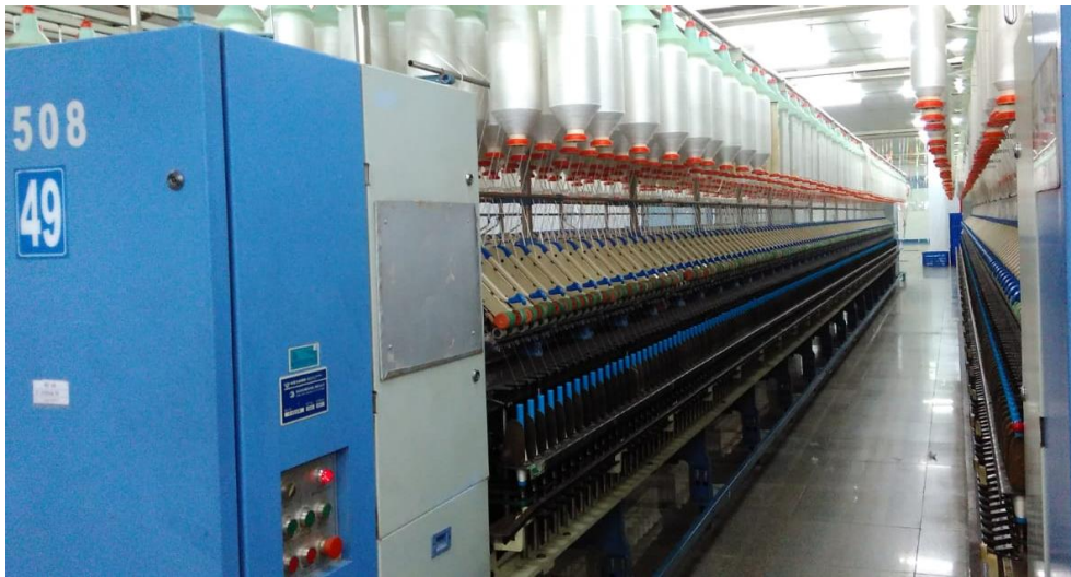
Lampiran 1 Mesin Ring Spinning