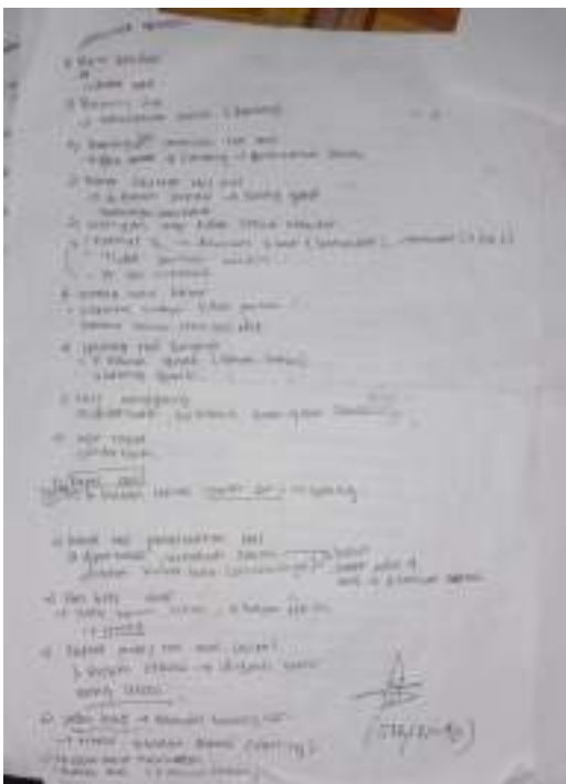
Lampiran 6 Informasi Hasil Wawancara Mekanik