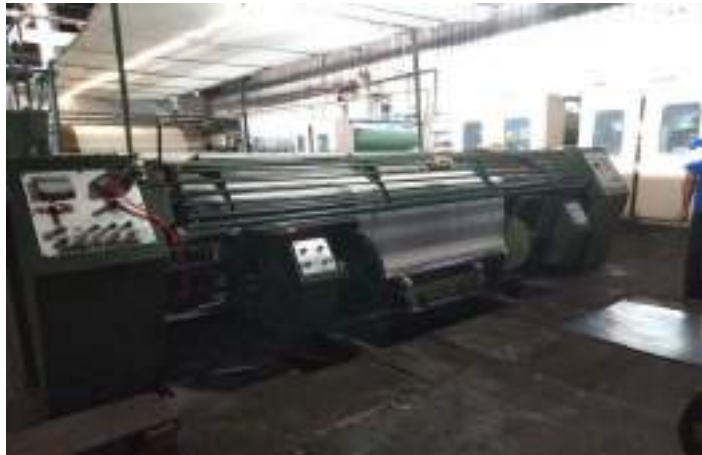
Lampiran 3 Mesin Sizing Rolux Enterprise