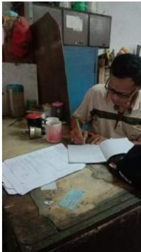
Lampiran 2 Diskusi Mengenai Kerusakan Mesin Sizing dengan Mekanik