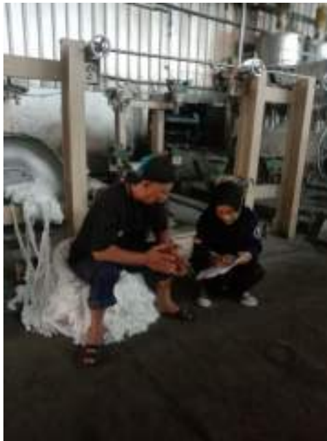
Lampiran 1 Wawancara Mekanik