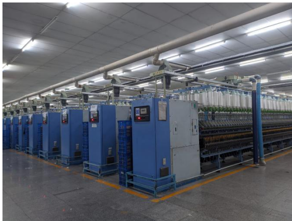
Lampiran 5 Mesin speed frame