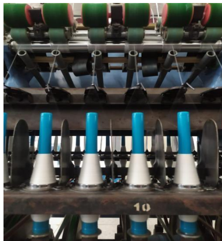
Lampiran 7 Mesin winding