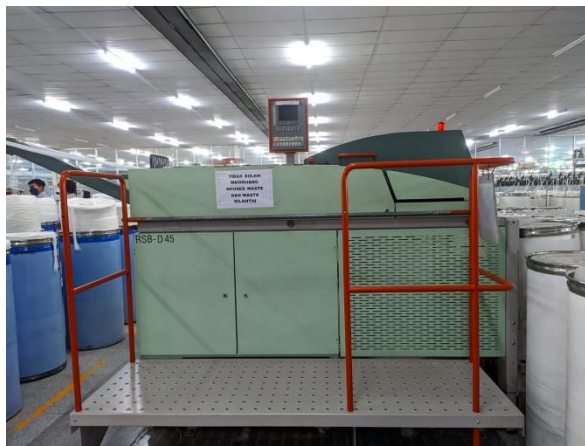
Lampiran 3 Mesin drawing breaker